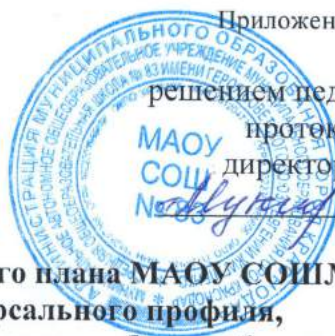
Таблица-сетка часов учебного плана МАОУ СОШ № 83 10 «В» класса универсального профиля, реализующего ФГОС-2022 среднего общего образования 2023 – 2024 учебный год